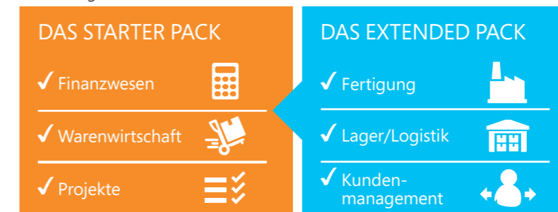
Abbildung 2: Starter Pack und Extended Pack – Funktionalität

Beide Lizenzmodelle wurden für größtmögliche Einfachheit im Kaufprozess konzipiert. Kunden können zwischen zwei Nutzertypen auf Basis von Concurrent Users, das heißt nicht namensgebundenen Benutzern, wählen: Limited User und Full User. Zudem können sie bei umfassenderen Anforderungen den Zugriff dieser Nutzer auf das Extended Pack lizenzieren.