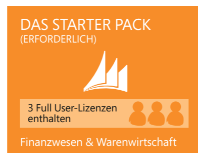
Abbildung 3: Starter Pack

Für viele Unternehmen sind die Funktionalitäten in dieser Lizenzkomponente bereits ausreichend.