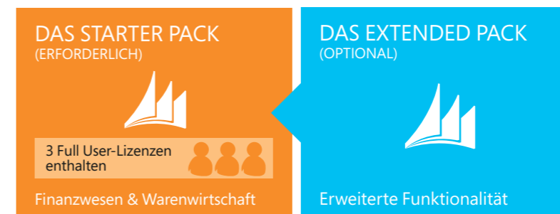
Abbildung 4: Extended Pack

Die im Starter Pack enthaltenen ersten drei Benutzer erhalten Zugriff auf alle zusätzlichen Funktionalitäten.