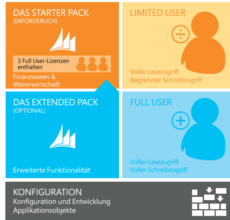
Abbildung 1: Perpetual Licensing im Überblick

Das Lizenzmodell Perpetual Licensing für Microsoft Dynamics NAV 2015 unterstützt mittelständische und kleine Unternehmen beim unmittelbaren, kostengünstigen Einstieg in die Bereiche Finanzwesen und Warenwirtschaft und ermöglicht ihnen, nach und nach weitere Bereiche einzubeziehen. Bei Perpetual Licensing lizenzieren Sie die Funktionalität der ERP-Lösung, und der Zugriff auf diese Funktionalität wird mittels Nutzerlizenzen sichergestellt.